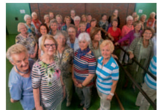
Tanzgruppe Golden Swingings