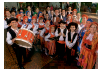
Portugies. Folkloregruppe St. Antonius