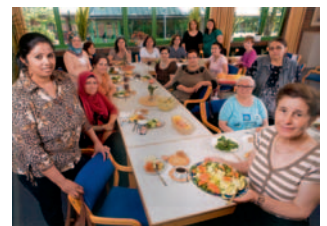
Migrantinnenverein Dortmund e.V.